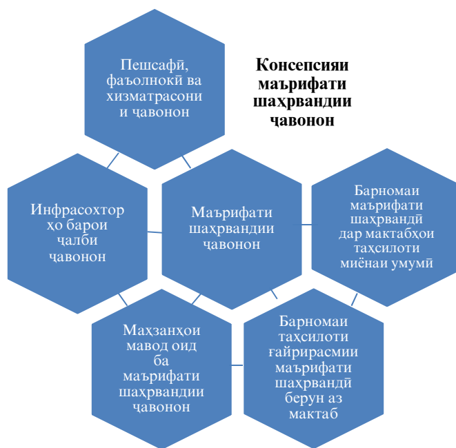
Нақшаи 1. Қисмҳои таркибии системаи маърифати шаҳравандии ҷавонон

Ҳар унсурҳои ташкили чараёни маърифати шаҳравандии ҷавонон дорои мақсад, вазифа ва натиҷаҳои ниҳой буда, дар якҷоягӣ ин чараёнро ба системаи том табдил медиҳанд. Дар ҷадвали поён мақсад, вазифа ва натиҷаҳои ниҳойи унсурҳои мазкурҳои системаи маърифати шаҳравандии ҷавонон тафсир мегарданд.