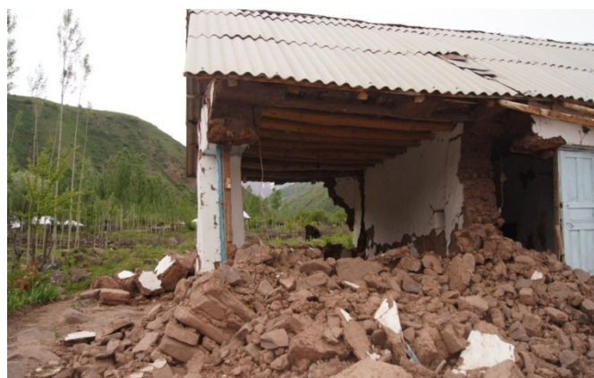
Рисунок 1. Частично разрушенный дом в кишлаке Руботнол

Все четыре дома не были повреждены и находятся в хорошем состоянии, демонстрируя эффективность и необходимость соблюдения мер по сейсмическому усилению. Группа предлагает провести более детальное обследование жилых домов построенных в 2007 году для оценки их сейсмической устойчивости и рациональности дальнейшего использования данной методики.