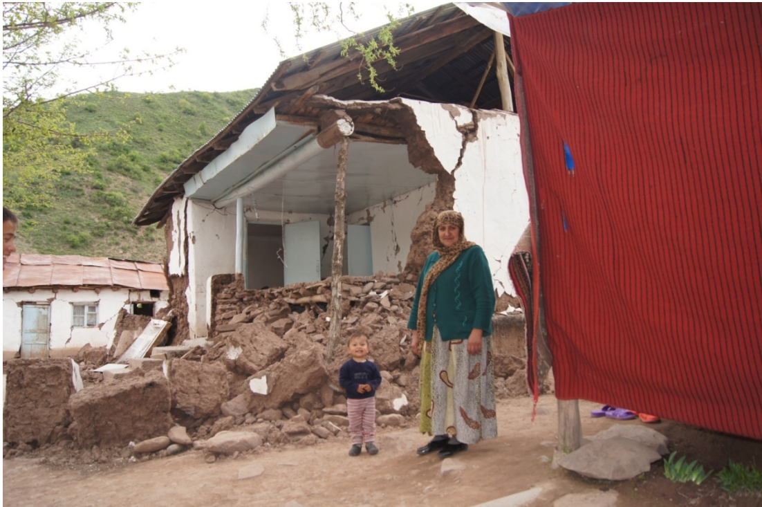
Разрушенный дом в селе Руботнол джамоата Чилдара, Тавильдаринский район