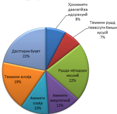
Самтҳои афзалиятноки ўҳдадориҳо дар доираи СРМ/СПСК барои солҳои 2010-2012 аз рӯи ташкилотҳо (бо дастгирии буҷет)